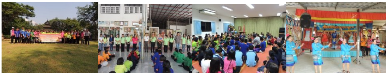
รุ่นที่ ๑ ระหว่าง วันที่ ๒๕ – ๒๖ มีนาคม ๒๕๕๗