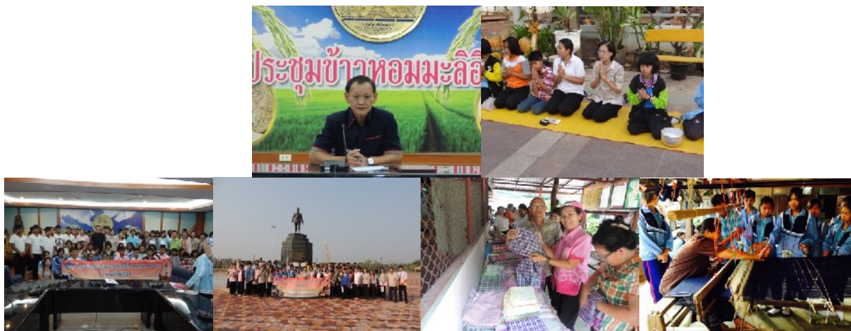
รุ่นที่ ๑ ระหว่าง วันที่ ๒๐ – ๒๑ มีนาคม ๒๕๕๗